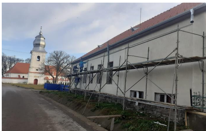
Modernizarea căminului cultural Lisnău

Tot în cursul anului 2022, am început lucrările de Modernizare a căminului cultural Lisnău și de Reabilitare a clădirii școlii din localitatea Bicfalău . Amândouă lucrări sunt foarte importante, dacă luăm în