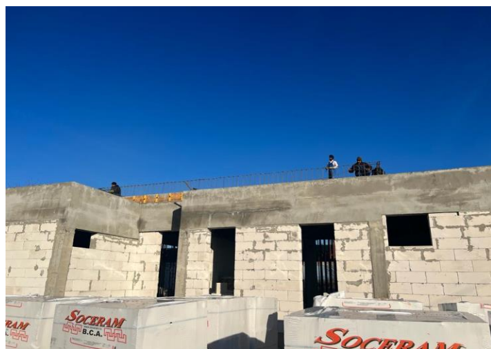
Construire Grădinița cu program prelungit

Construirea Grădiniței cu program prelungit în localitatea Ozun , este un alt proiect important pentru