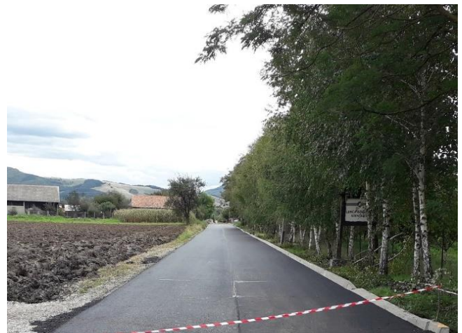
Asfaltare DC34A Lunca Ozunului