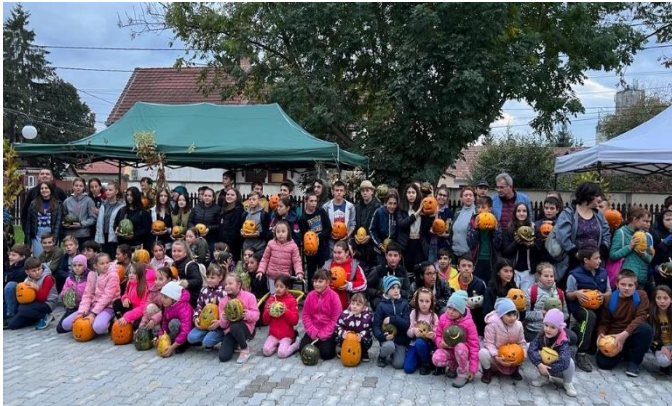
Copiii cu felinarele de dovleac

Am organizat diverse programe pentru elevii Școlii Gimnaziale Sándor Tatrangi Sandor din Ozun, la care copiii au participat într-un număr mare. Cu ocazia zilei de 1 Iunie, am organizat o zi a copiilor în parcul de agrement, unde elevii au participat la diverse concursuri și jocuri. În cadrul Zilelor de Toamnă din luna octombrie, i-am invitat la o proiecție de filme, ocazie cu care am organizat și o după-amiază de pregătire a unor felinare din dovleac