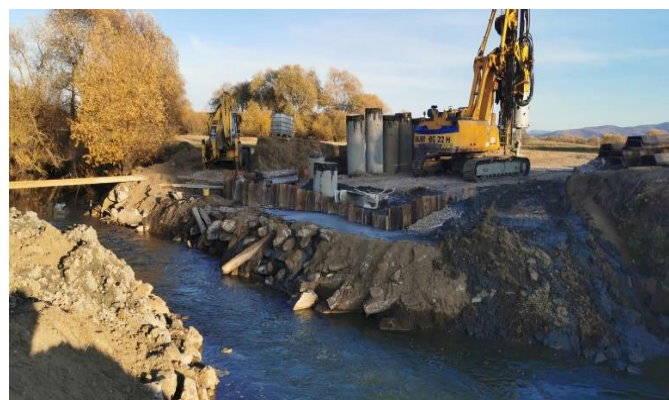
Construire pod peste Râul Negru

La nivelul localității Sântionlunca, în primăvara acestui an, am semnat contractul de lucrare și în cursul verii au început lucrările pentru Modernizarea drumului comunal DC16A , lucrare care conține și construirea unui pod de beton peste Râul Negru precum și asfaltarea străzii Morii și a drumului până la pod pe o lungime de 1,7 kilometri. După mai multe încercări, în final Agenția de Protecție a Mediului și-a dat avizul favorabil pentru acest proiect, ca urmare am putut să demarăm procedura de achiziție a lucrărilor. Realizarea acestui pod este o mare necesitate în viața comunității de aici, deoarece din anul 2019, de când o viitură a luat vechiul pod din lemn, locuitorii din sat nu au avut o cale de acces peste râu către terenurile agricole de pe malul celălalt.