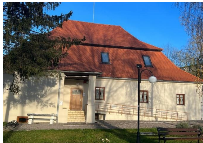
Conacul Pünkösti din Ozun

După o pauză de doi ani, din cauza pandemiei, anul acesta am reușit să organizăm din nou evenimentele noastre devenite deja tradiționale, Zilele Comunei Ozun și Zilele Sântionlunca. Cu aceste ocazii locuitorii comunei și oaspeții noștri au avut parte de o serie de manifestări culturale, sportive, gastronomice. În cadrul Zilelor Comunei Ozun, pe lângă aceste manifestări, așa cum este obiceiul în Comuna Ozun, am avut și o inaugurare a unei clădiri recent renovate. Conacul Pünkösti din Ozun, este un conac construit încă din secolul al XVII-lea, un monument istoric de categoria A, a fost restaurat cu finanțare din fonduri europene, la această dată aici au sediile asociațiile nonprofit din localitate, și anume Asociația Culturală Atlantisz, Asociația Tinerilor IMUK și Asociația Pensionarilor din Ozun.