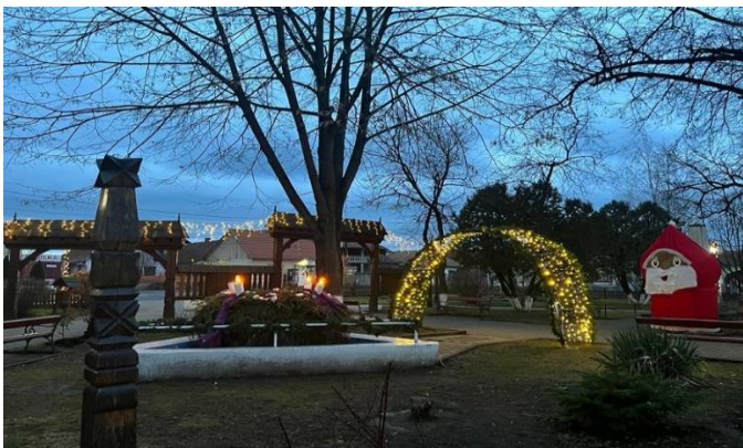
Coroana de Advent în parcul central

În perioada de dinaintea Crăciunului, în curs de patru săptămâni, în fiecare duminică am aprins câte